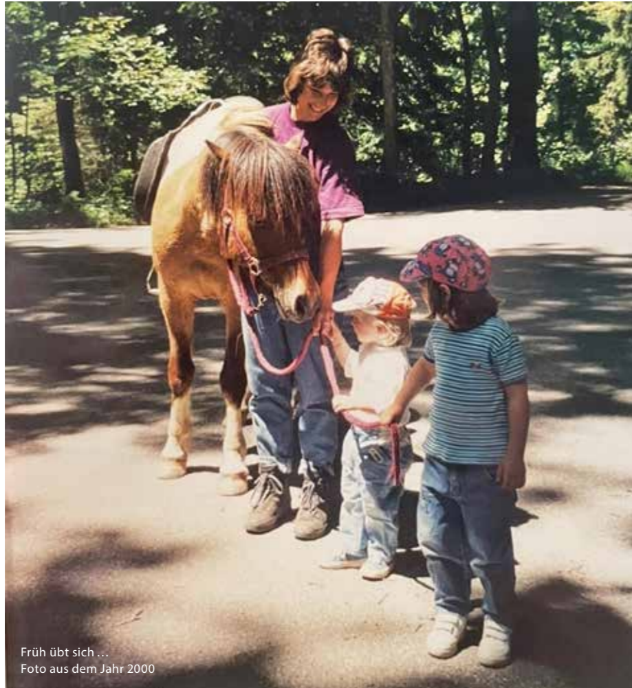
Früh übt sich ... Foto aus dem Jahr 2000