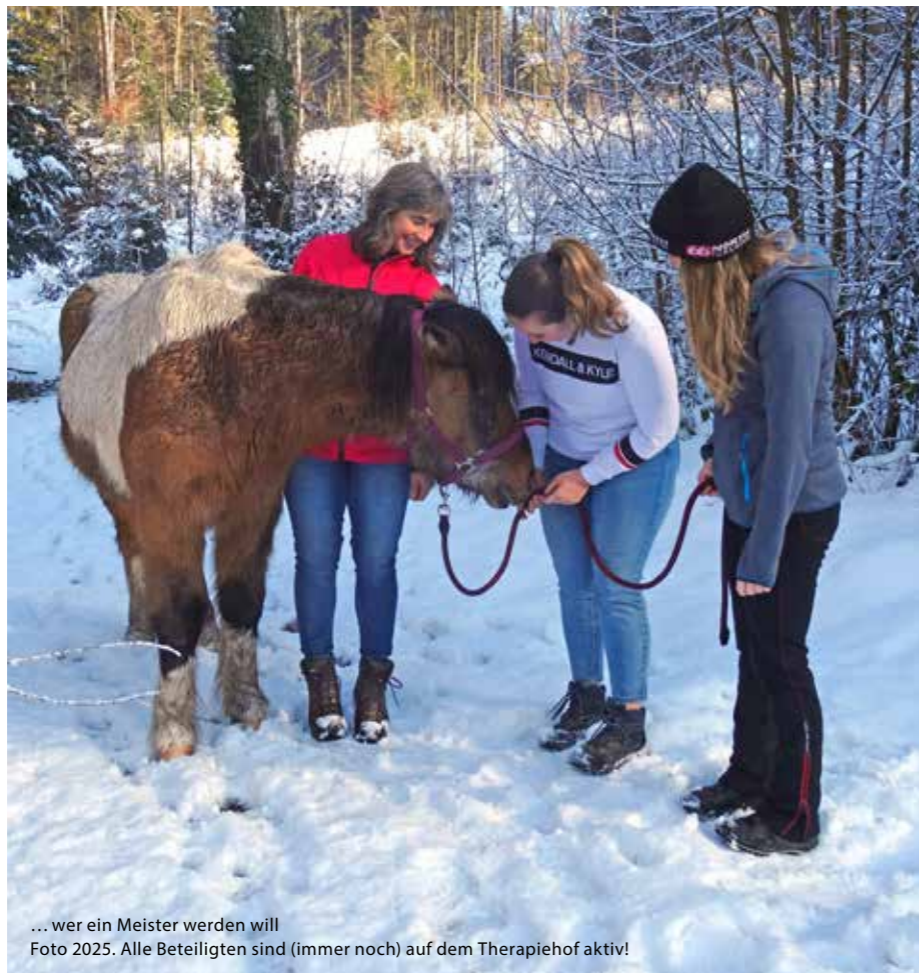
... wer ein Meister werden will Foto 2025. Alle Beteiligten sind (immer noch) auf dem Therapiehof aktiv!